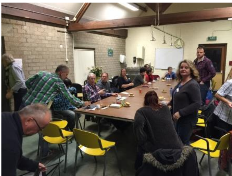
Impressie Vrijwilligersbijeenkomst 19 november 2015

Vanwege het groeiende aantal hulpen reparatieverzoeken blijft het nodig om nieuwe vrijwilligers te werven. In 2016 gaan we een wervingscampagne uitvoeren waarvoor extra organisatorische en financiële inspanningen nodig zijn.